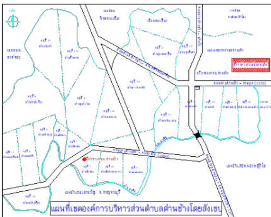
แผนที่องค์การบริหารส่วนตำบลด่านช้าง อำเภอด่านช้าง จังหวัดสุพรรณบุรี